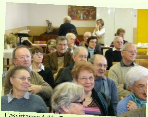
L'assistance à l'A. G. du 30 janvier 2010