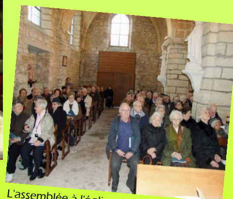
L'assemblée à l'église de Chapet