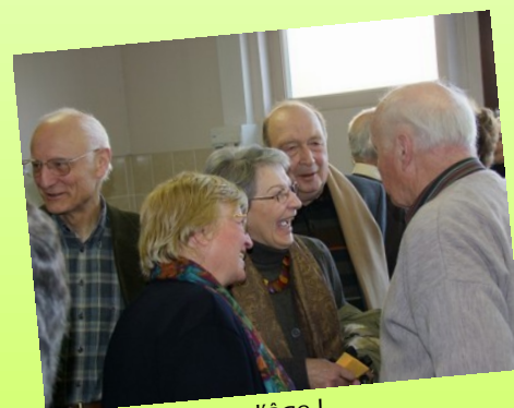
L'amitié n'a pas d'âge !...