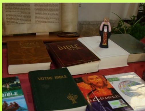
La Parole de Dieu proclamée et célébrée...