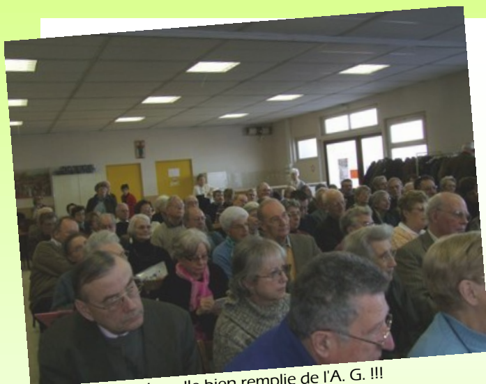
La salle bien remplie de l'A. G. !!!