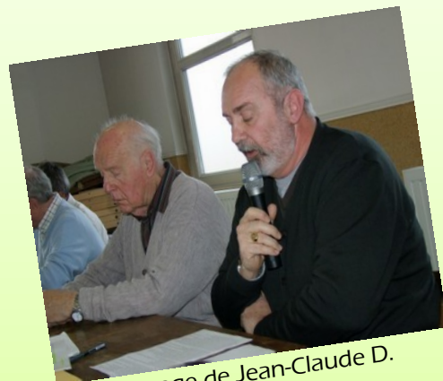
Témoignage de Jean-Claude D.