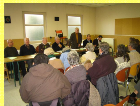
Rapport moral et financier puis témoignages