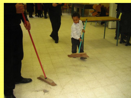
Dernier coup de balai : tout le monde s'active !