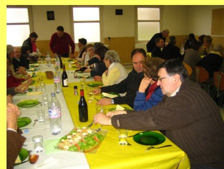
Un partage d'amitié