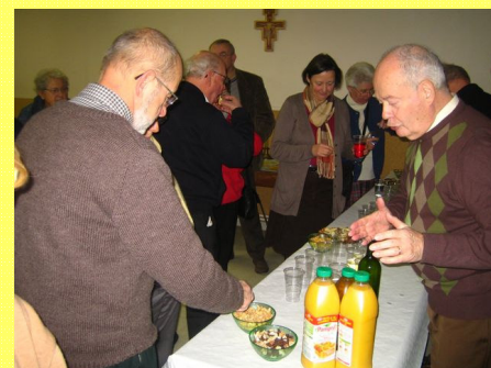
La joie de se retrouver pour échanger